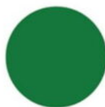
zielony RAL 6029