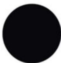
czarny RAL 9005