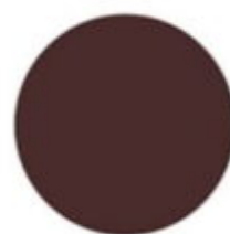
brązowy RAL 8016