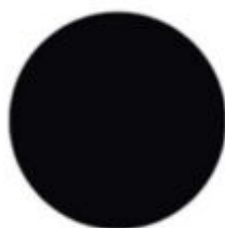
czarny RAL 9005