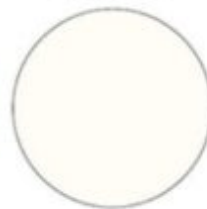
biały RAL 9016