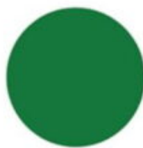
zielony RAL 6029