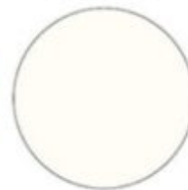
biały RAL 9016