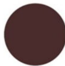
brązowy RAL 8016