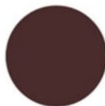
brązowy RAL 8016