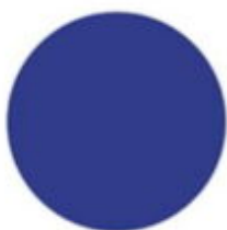
niebieski RAL 5002