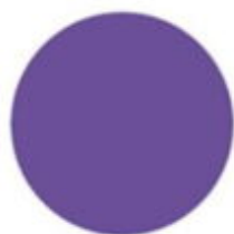
fioletowy RAL 4005