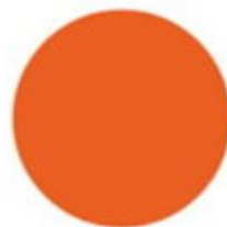
pomarańczowy RAL 2004