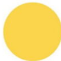
żółty RAL 1018