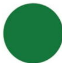
zielony RAL 6029