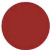
bordowy RAL 3003