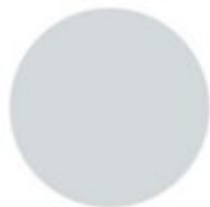
popiel RAL 7035