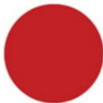
czerwony RAL 3020