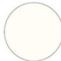
biały RAL 9016