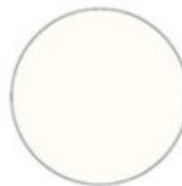
biały RAL 9016