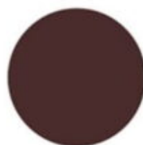
brązowy RAL 8016