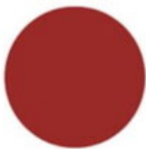
bordowy RAL 3003