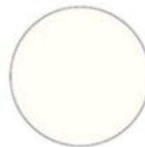
biały RAL 9016