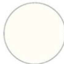
biały RAL 9016