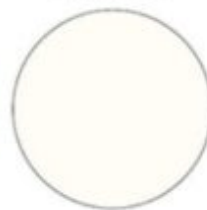
biały RAL 9016