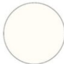
biały RAL 9016