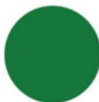
zielony RAL 6029