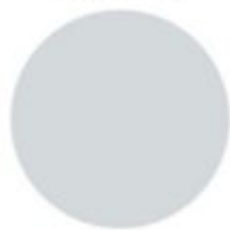
popiel RAL 7035