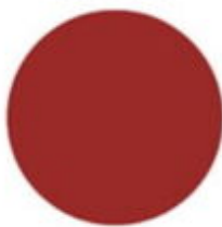
bordowy RAL 3003