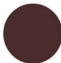
brązowy RAL 8016