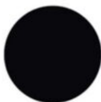
czarny RAL 9005