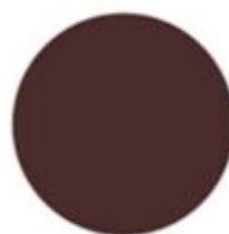
brązowy RAL 8016