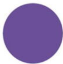
fioletowy RAL 4005