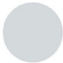
popiel RAL 7035