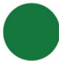
zielony RAL 6029