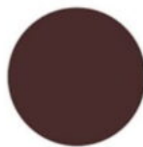
brązowy RAL 8016