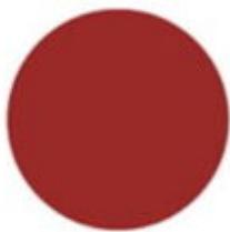
bordowy RAL 3003