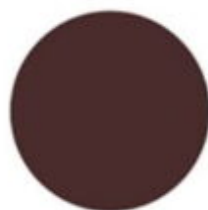
brązowy RAL 8016